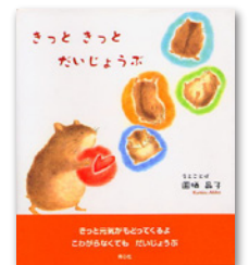
きつと きつと だいじょうぶ