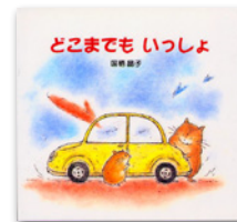
どこまでもいっしょ