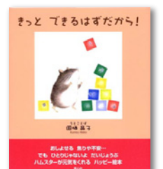
きつとできるはずだから!