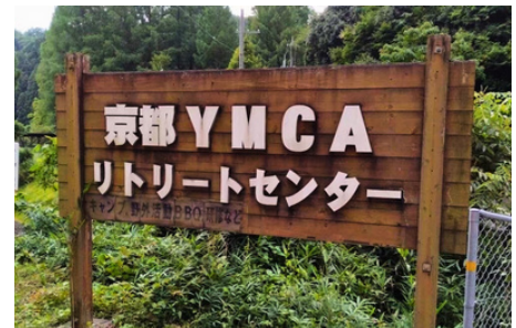
9/3 リトセン秋季準備ワーク 佐古田正美