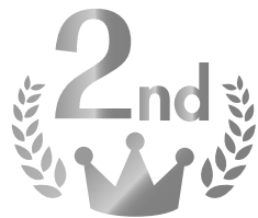
『顔がイラっとくる』 撮影者 伊神康喜