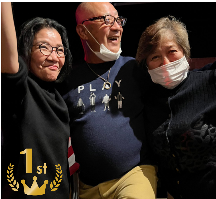
『無邪気なおじさんとおばさん』