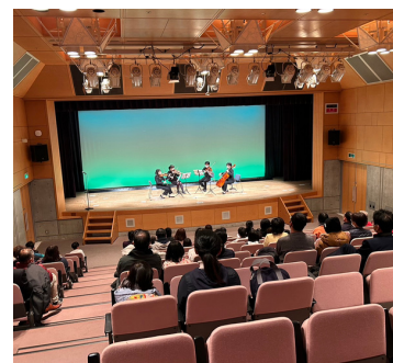
12月23日 YMCA市民クリスマス 高倉英理(4ページ)