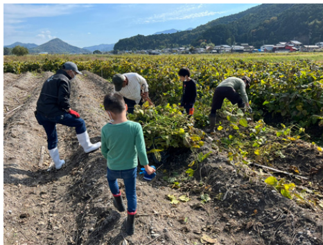
切り取った株を電動一輪車に