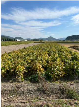
これから刈り取るぞ！