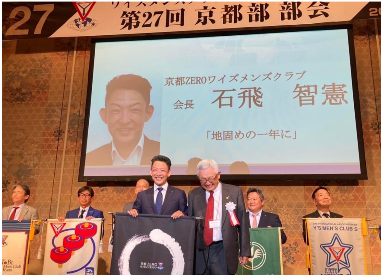
第1位 『やっぱり1位は門出の写真で』