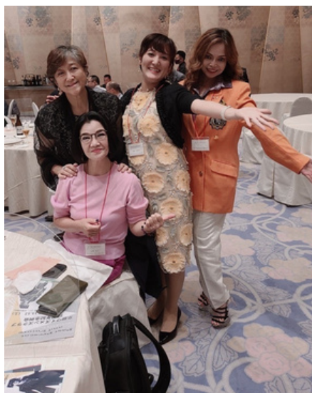
第2位 『ZEROの美獣たち』