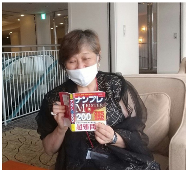
第3位 『ナンプレを持ってきてるとは!』

毎月のベストショット賞と季節ごとにシーズンベストショット賞(賞品アリ) みなさん13期専用の写真アルバムにどんどん写真をアップして下さい!