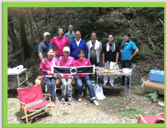
東屋の修復作業を行い、見事にリノベーション 出来ました