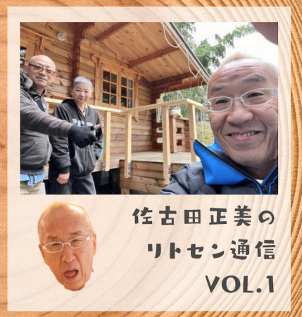
佐古田正美の リトセン通信 VOL.1