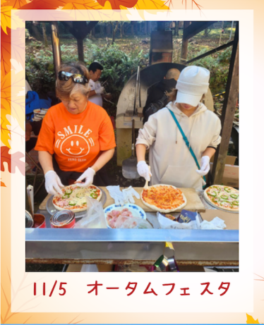
11/5 オータムフェスタ