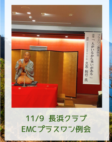
11/9 長浜クラブ EMCプラスワン例会